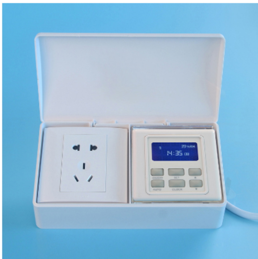
图二 产品正面结构图