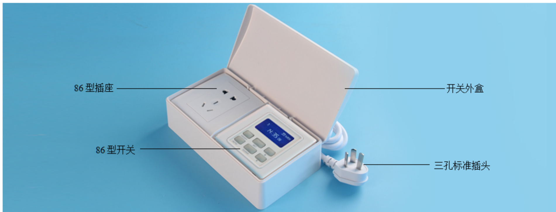
图六 开关面板示意图