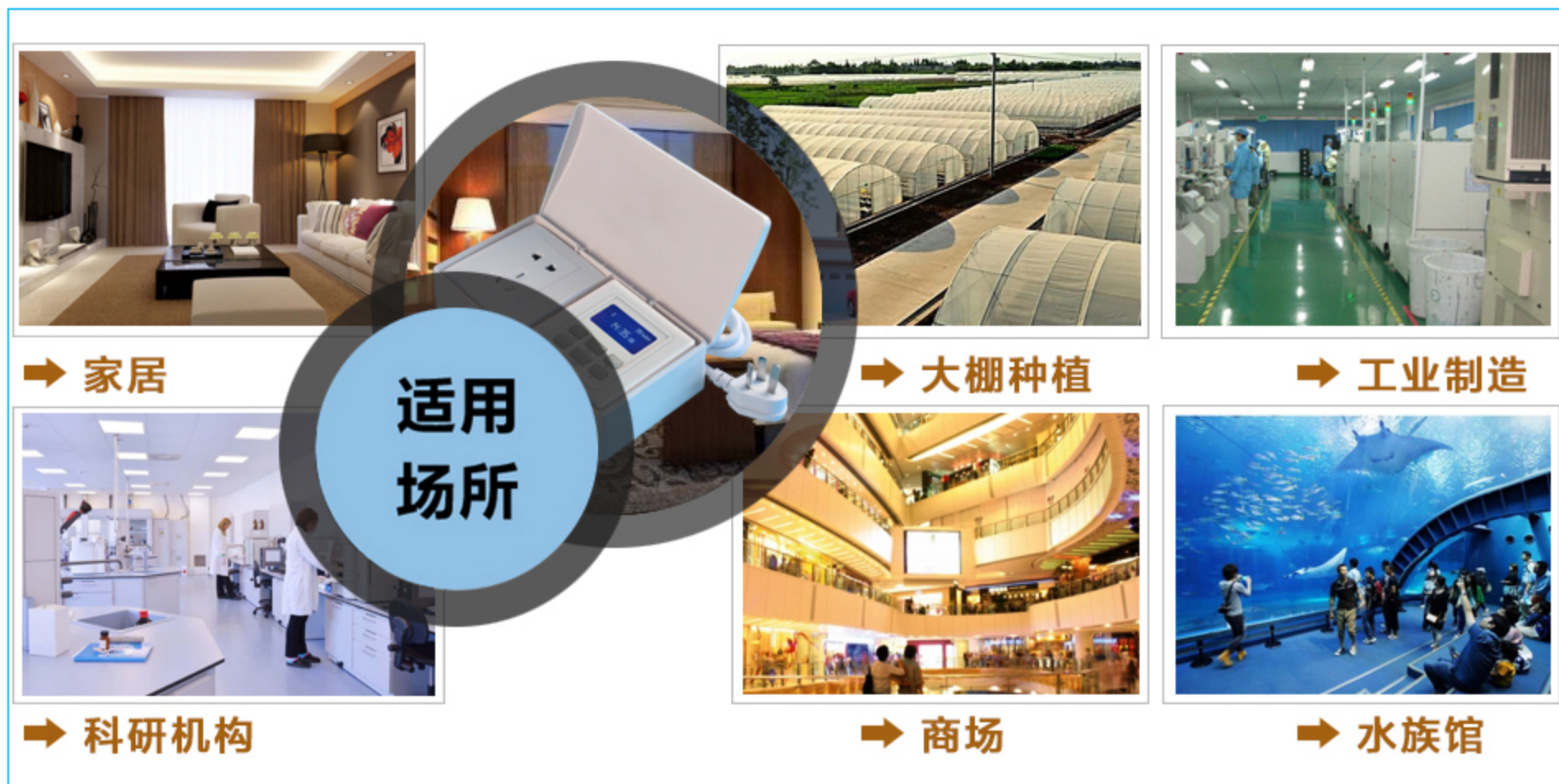
图一 产品适用场景示意图